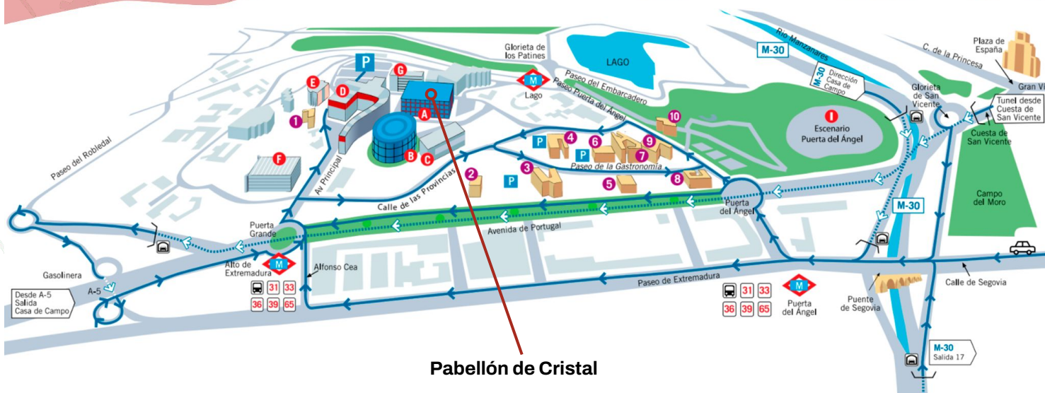
Pabellón de Cristal

Dirección: Avenida Principal, 16 – 28011, Casa de Campo (Madrid)